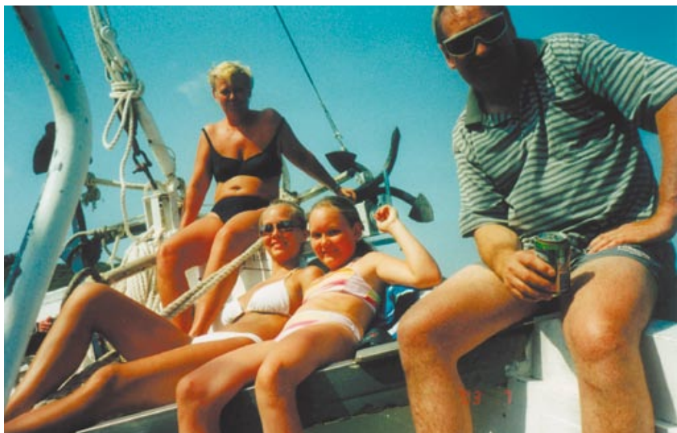
Der skal ikke meget skib til før folk fører sig frem.