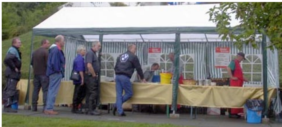
Kø ved pølseboden.

Lørdag skinner solen så den bliver tur dag. Da ingen af de andre kan smøle sig færdig eller gider, kører jeg alene. Med mit ny indkøbte kort går det først til Bad Harzburg derefter øst på og senere