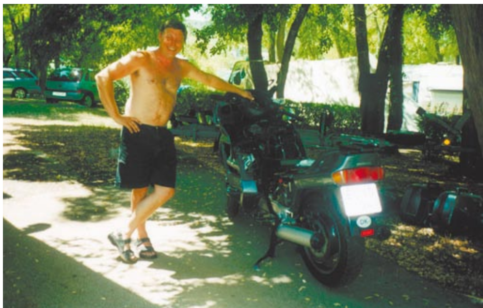
Dagene gik alt for hurtigt, med med mulighed for at "skrue i Honda".....

Dagene gik alt for hurtigt, med alt lige byture med mulighed for at få en tatovering, "skrue i Honda", ik' Arne, bade, dase, eller en tur på vandscooter. Det sidste var godt at vi først prøvede den sidste dag, for ellers havde vi nok ikke kunne holde vores sommerbudget.