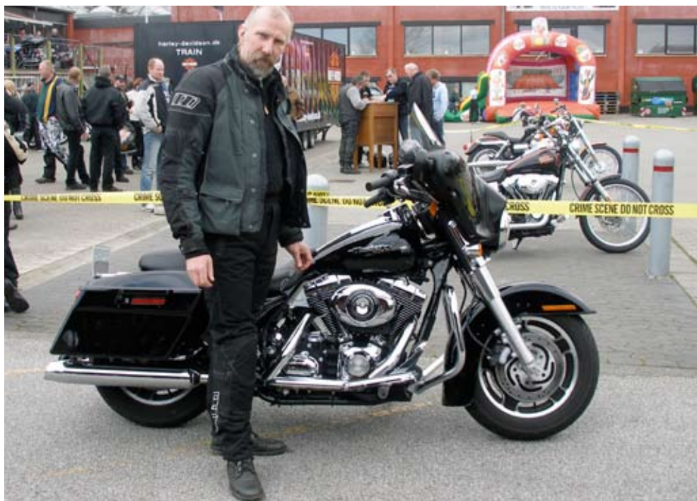
Redaktøren på Harley. Han ku ikke li det.