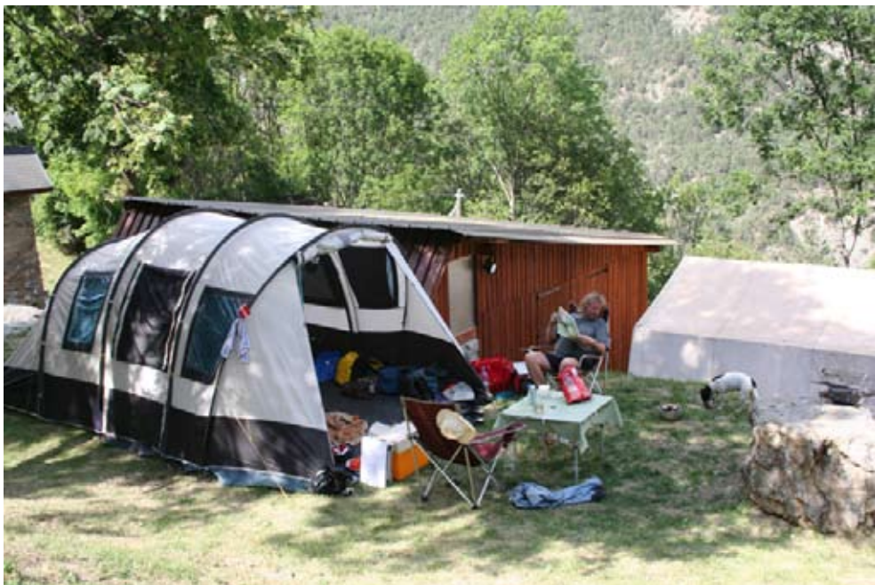
Træskuret bagved vores telt er baren. Til højre for baren et telt, og længere til højre en bålplads (ikke på billedet).