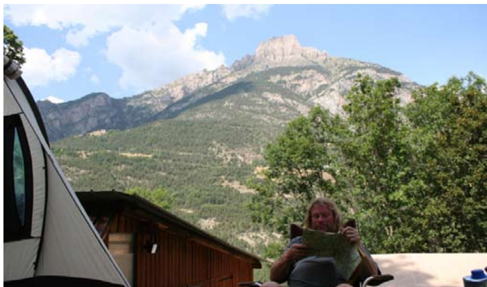
Udsigten til bjerget overfor